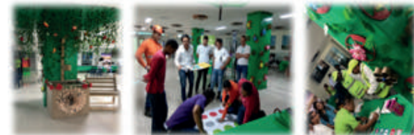
Semana de Gestión Integral