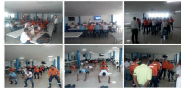
Entrenamiento Brigada de Emergencia