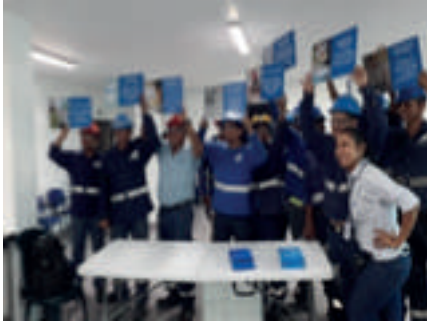
Campaña Día del agua