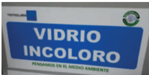
Campaña Separación de vidrio