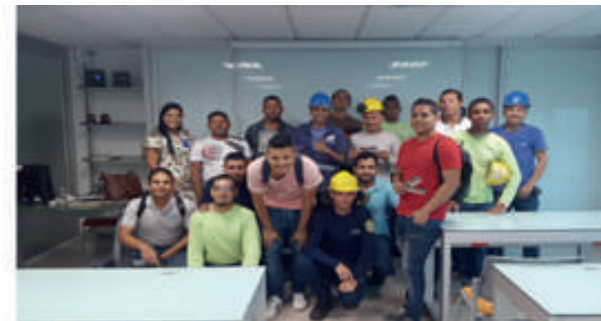
Alcanza tu Proyecto de Vida sin drogas