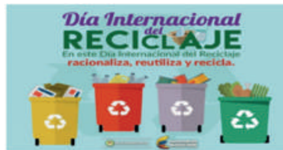
Campaña Día Internacional del Reciclaje