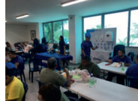
Campaña Lavado de manos