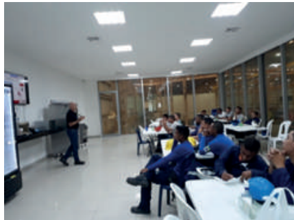
Capacitación Tuberías PVC