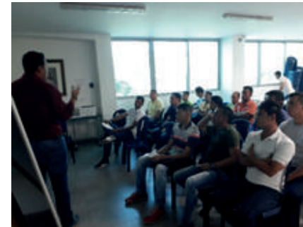
Capacitación Osmosis inversa

Mantener el indicador de consumo de agua por persona de 0,9 m3.